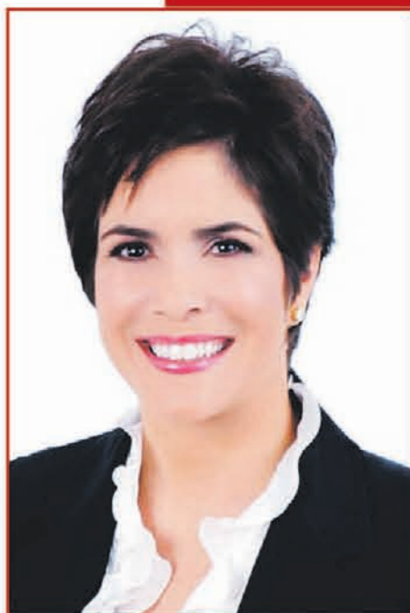
María Eugenia Ferré Rangil Presidenta de El Nuevo Día

Este año celebramos por todo lo alto la Octava Edición de los Premios El Nuevo Día Educador en una ceremonia memorable y llena de emoción, donde premiamos los mejores estudiantes de todo Puerto Rico. La premiación tuvo un toque muy especial, no sólo porque reconocimos la excelencia académica y el compromiso social de estos jóvenes, sino porque coincidió con la celebración del 40 Aniversario de El Nuevo Día.