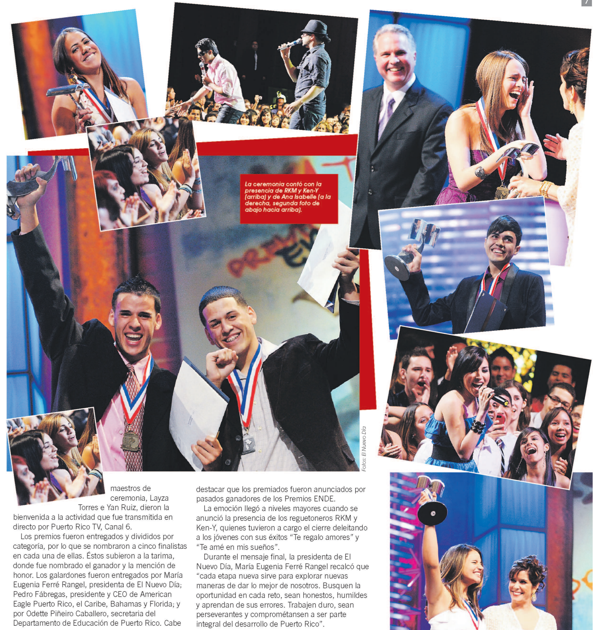
La ceremonia contó con la presencia de RKM y Ken-Y (arriba) y de Ana Isabelle (a la derecha, segunda foto de abajo hacia arriba).

La ceremonia comenzó con la presentación musical de la cantante Ana Isabelle, nominada para estos premios en el 2004, quien abrió el acto con la canción "Por amarte así". Acto seguido, los