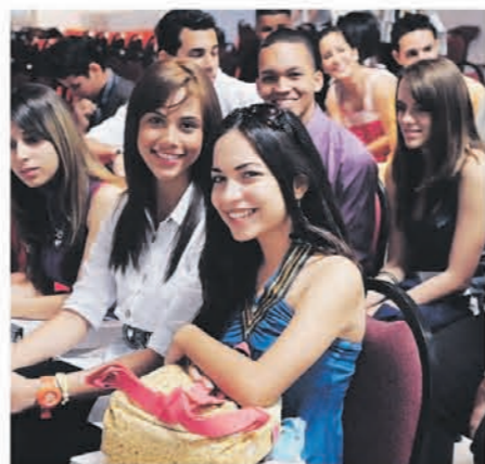
El proceso de entrevistas se llevó a cabo en las instalaciones de la Universidad del Sagrado Corazón.

Los estudiantes de todas las escuelas comparecerán para entrevistas ante un panel de jueces independientes, todos invitados por El Nuevo Día. Para cualificar, los estudiantes tienen que completar la solicitud, escribir un ensayo, comparecer a la entrevista ante el jurado y producir cada uno de los documentos requeridos por el Formulario de Nominación.